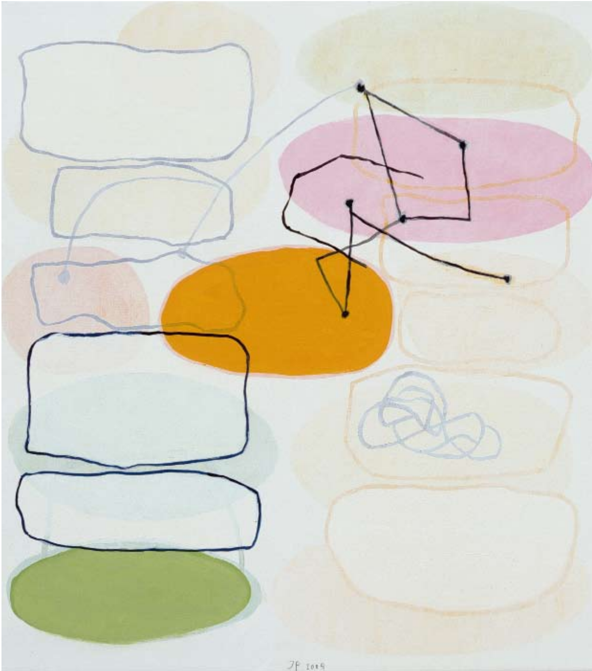
Carmen, 2005, Öl auf Leinwand, 50x45 cm, Courtesy Gaerie Has Strelow, Düsseldorf